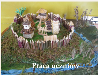
Марта Свідэрская і Юлія Вакулеўская

Дасягненні, якім мы цяпер можам ганарыцца давалі, што нашая школа носіць імя Роду Хадкевічаў.