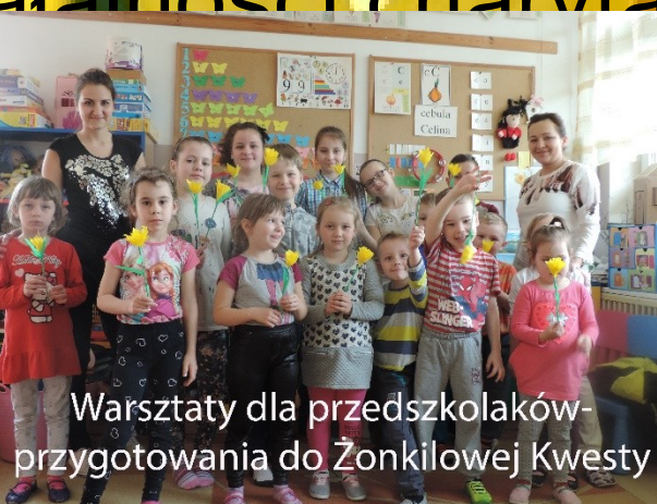
Warsztaty dla przedszkolaków- przygotowania do Żonkilowej Kwesty