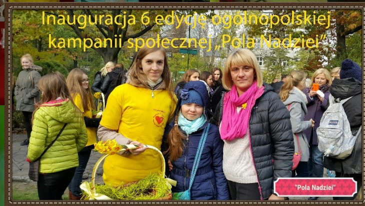
Inauguracja 6 edycji ogólnopolskiej kampanii społecznej „Pola Nadziei”