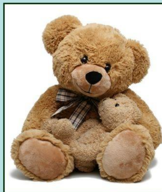
Miś produkowany współcześnie